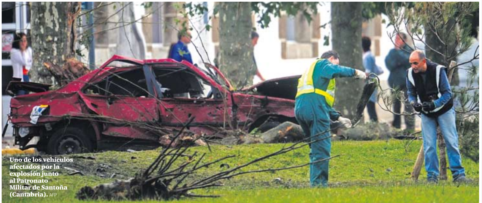
Uno de los vehículos afectados por la explosión junto al Patronato Militar de Santoña (Cantabria).