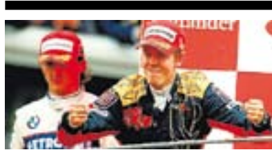
Fórmula1 GP DE ITALIA