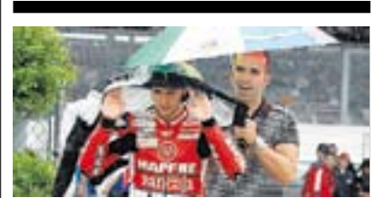
Motociclismo GP DE INDIANÁPOLIS