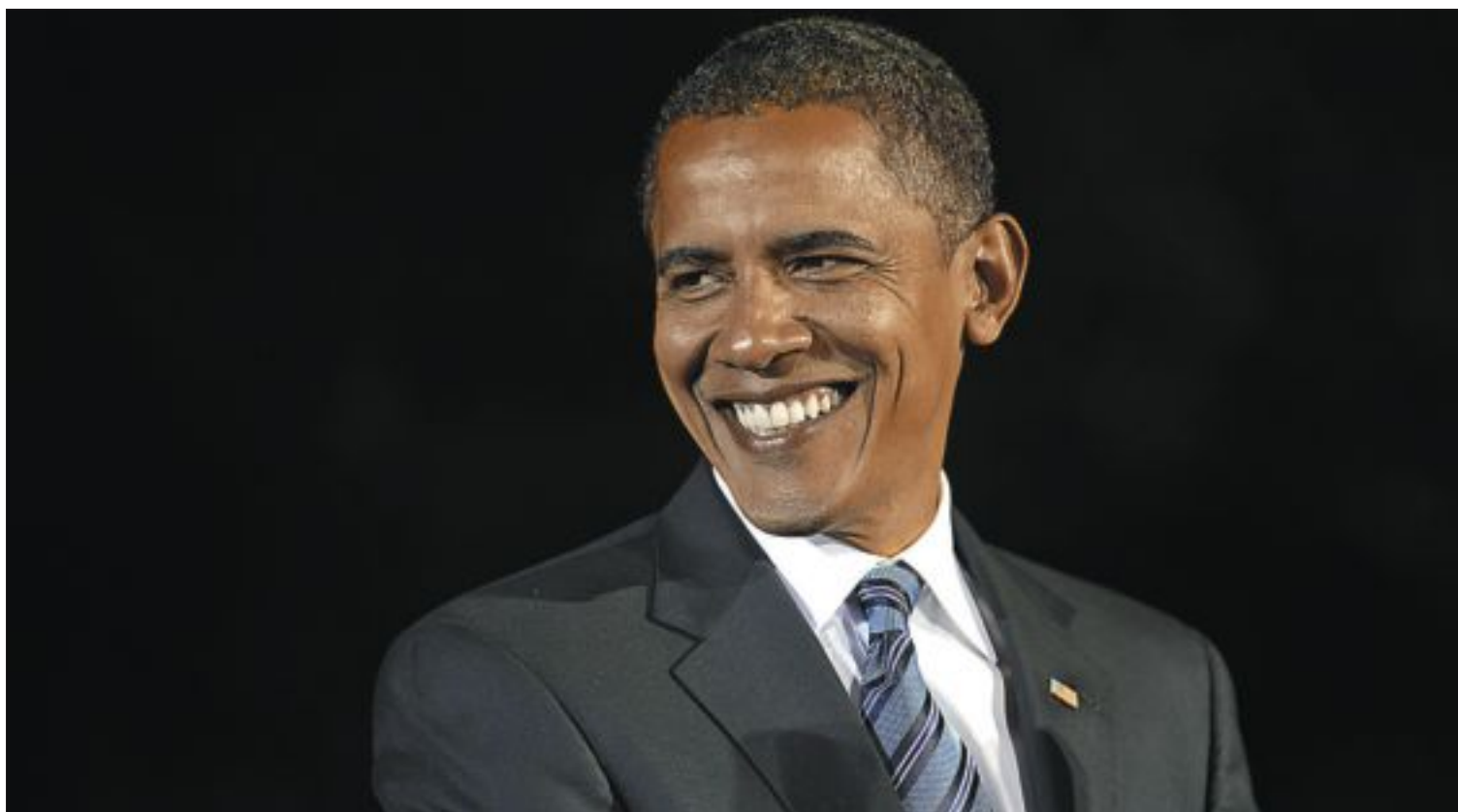
El senador Barack Obama sonríe a sus seguidores durante un acto de campaña celebrado en Indiana el viernes pasado.

EL CANDIDATO DEMÓCRATA LLEGA COMO FAVORITO A LA RECTA FINAL