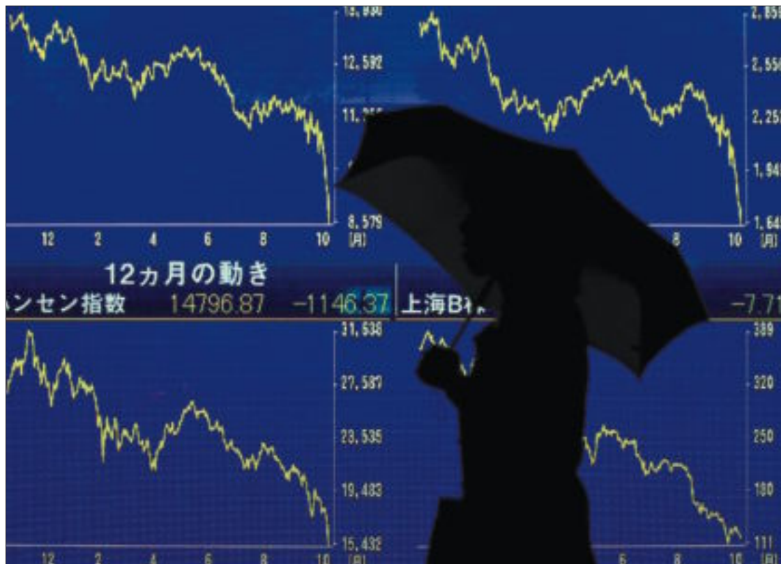
Una mujer pasa frente a un panel que muestra el descalabro de los valores de la Bolsa de Tokio.