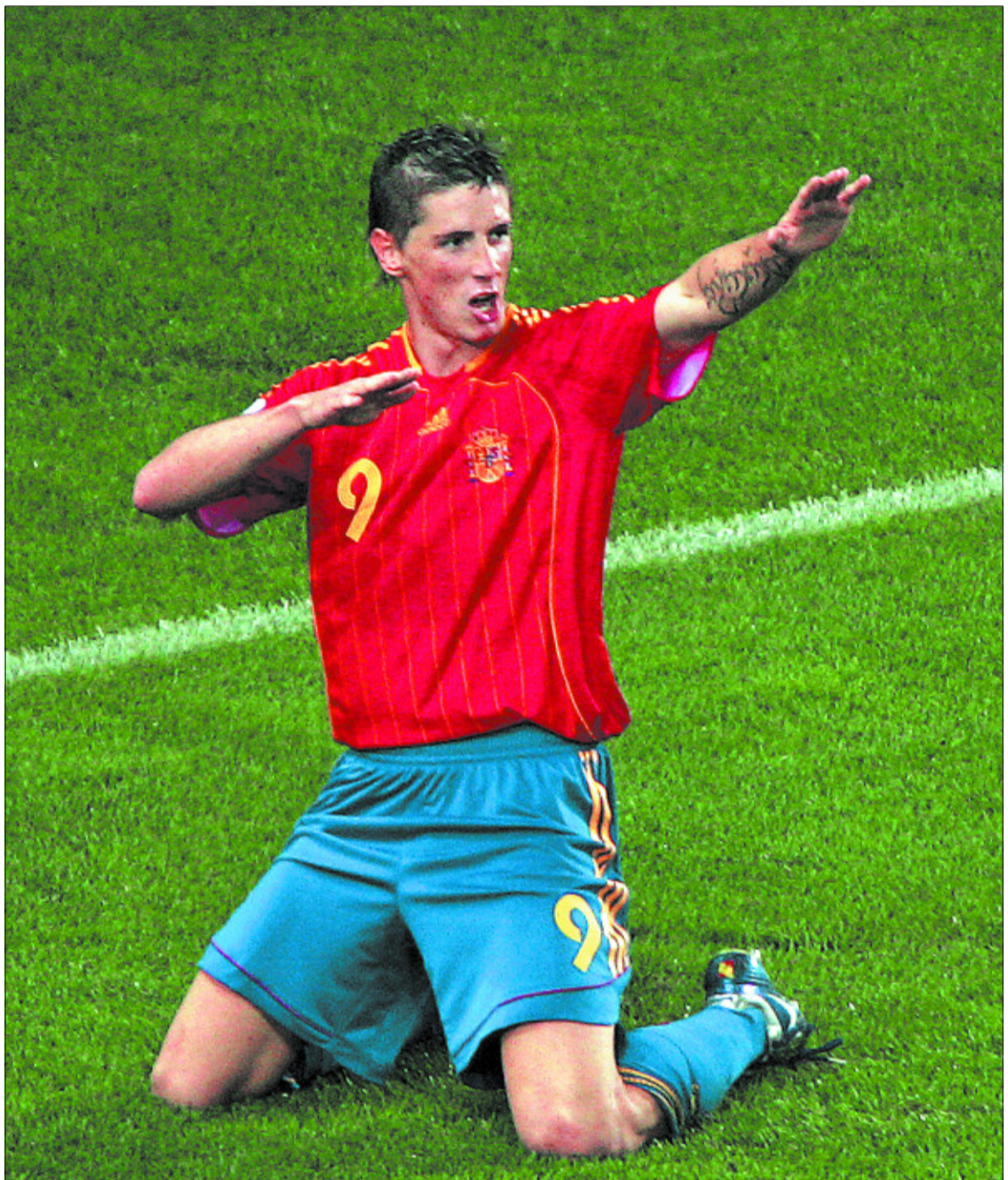
Fernando Torres celebra el segundo gol de España, el primero de los dos que anotó.