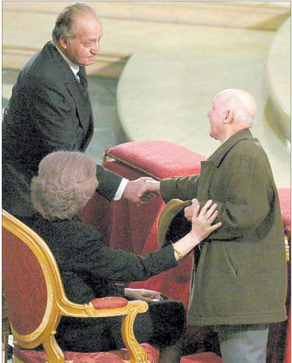
Don Juan Carlos y doña Sofía consuelan a un familiar de una víctima del 11-M en la catedral de la Almudena.