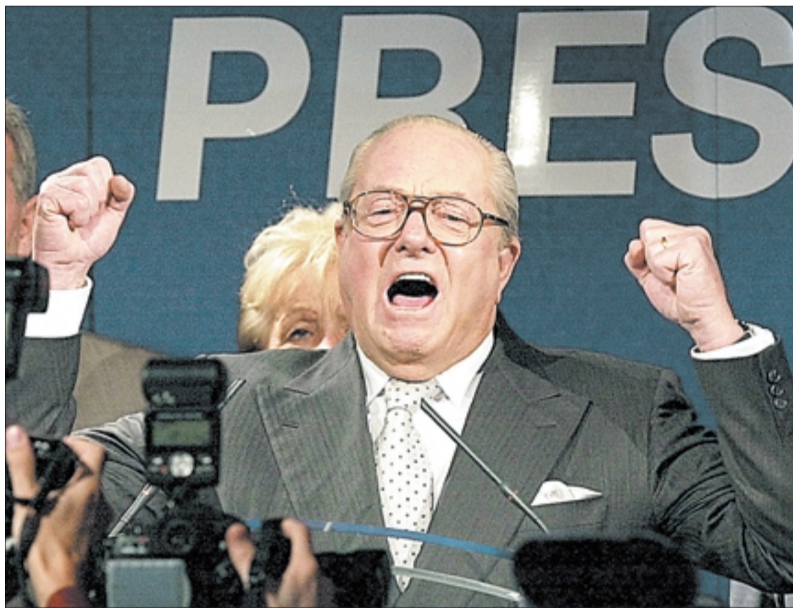
Jean-Marie Le Pen celebra los resultados en la sede de su partido.

Más información en páginas 3 a 6 Editorial en la página 12