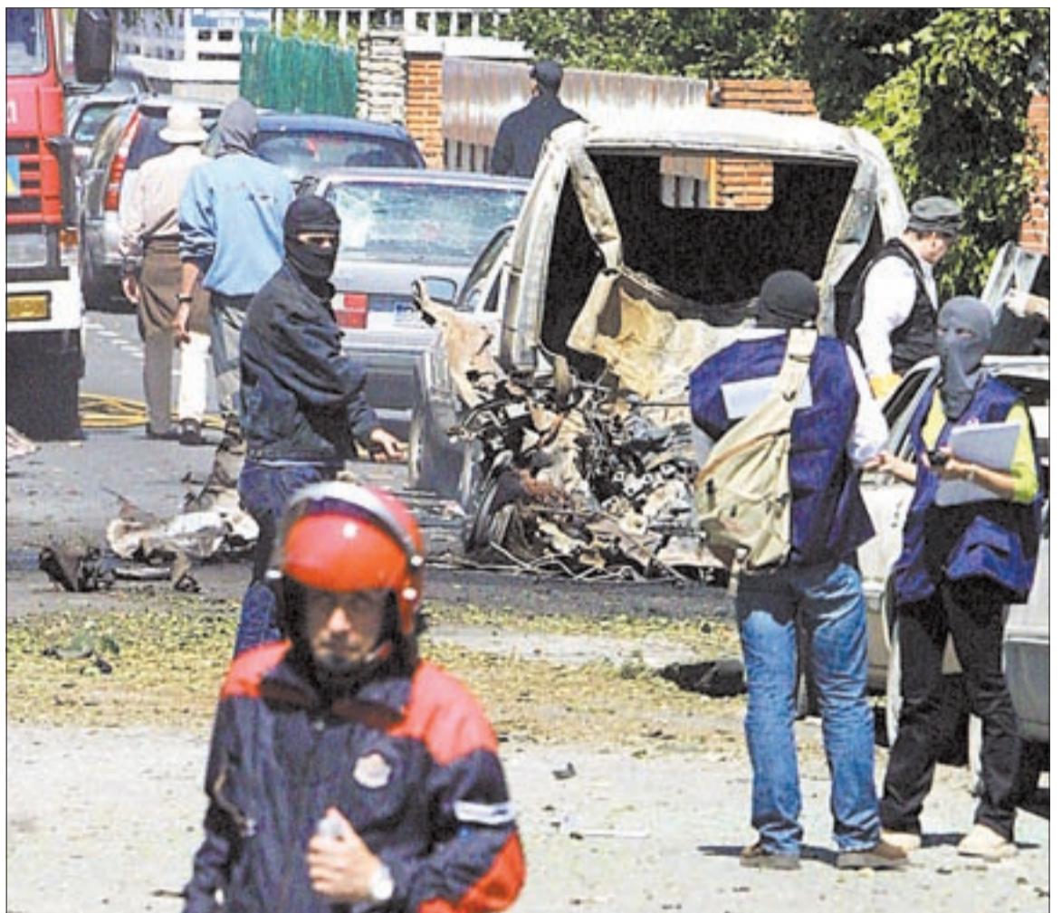
La policía vasca examina el lugar donde la banda terrorista ETA explotó ayer un coche bomba.

Ninguna foto en ninguna pared de Kabul recuerda al destronado y retornado rey de Afganistán, Mohamed Zahir Shah. No hubo bienvenida en carteles pegados a las ruinas de Kabul. Dicen en la capital afgana que si no hubiera sido por el imponente dispositivo de seguridad desplegado en el aeropuerto de Kabul, nadie habría sabido que estaban asistiendo el jueves a un momento histórico. Pasa a la página 8