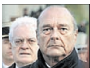
Lionel Jospin y Jacques Chirac.