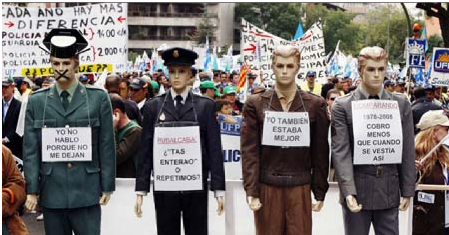
Cuatro maniqués, vestidos con los uniformes actuales y pasados, encabezan la manifestación luciendo carteles con las reivindicaciones de los agentes.

CRÓNICA descubre que el candidato ha 'falsificado' su heroica biografía