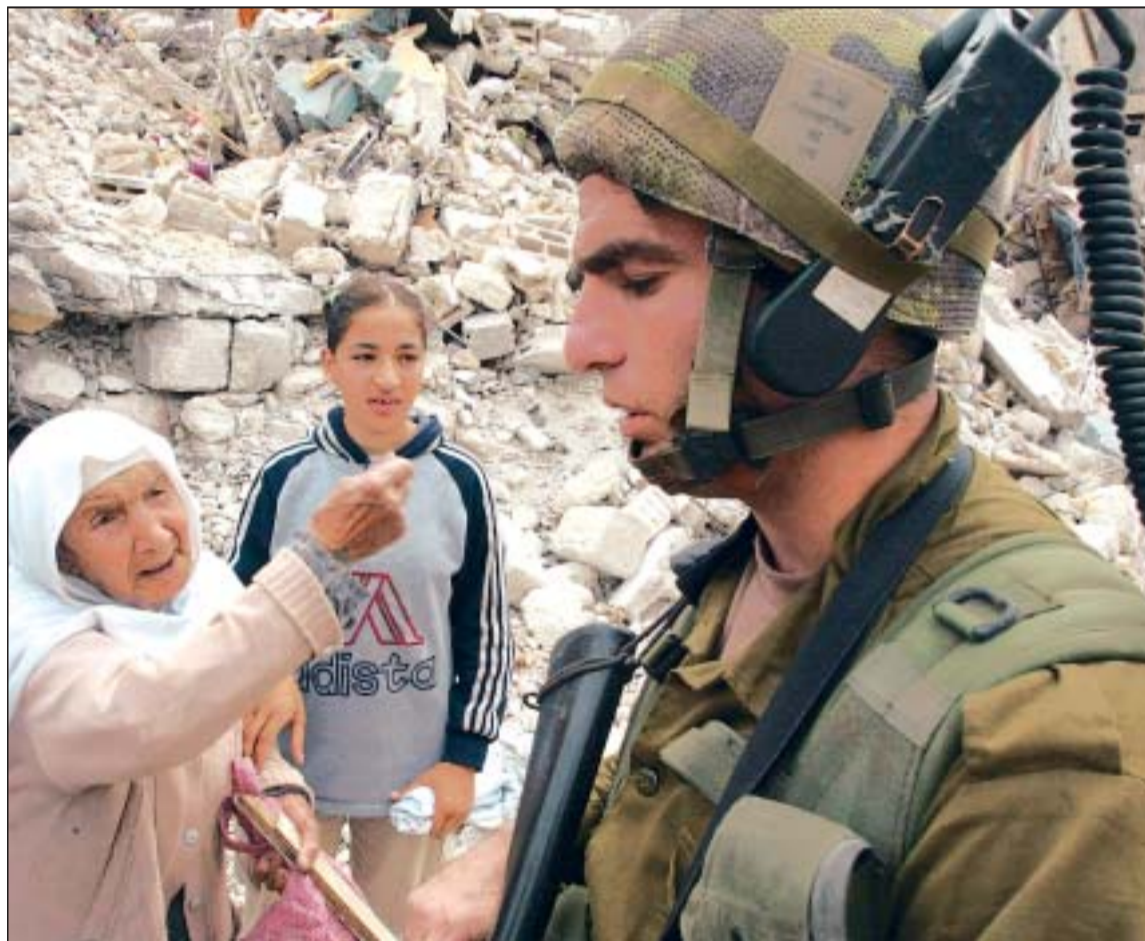
Una anciana palestina increpa a un soldado israelí, ayer, en el campo de refugiados de Yenín.