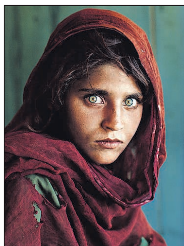
Sharbat Gula, en 1985.